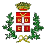
Comune di Nicosia